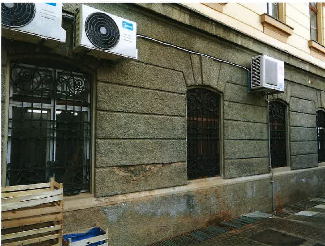
Dvorišno pročelje – prozori kuhinje