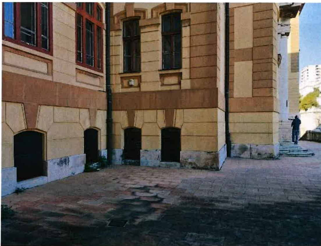
Ulazna terasa suda – stepenice pred ulazom